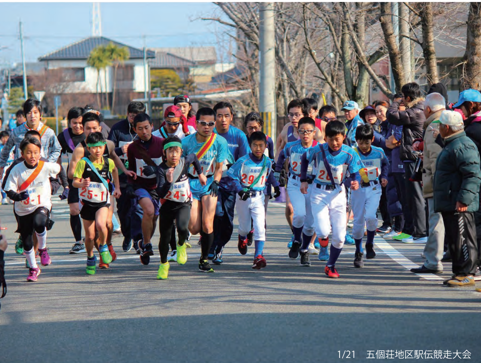
1/21 五個荘地区駅伝競走大会